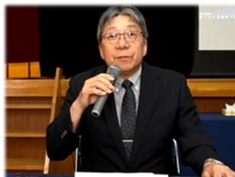
開会挨拶 豊田副会長