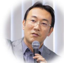
医療アドバイザー